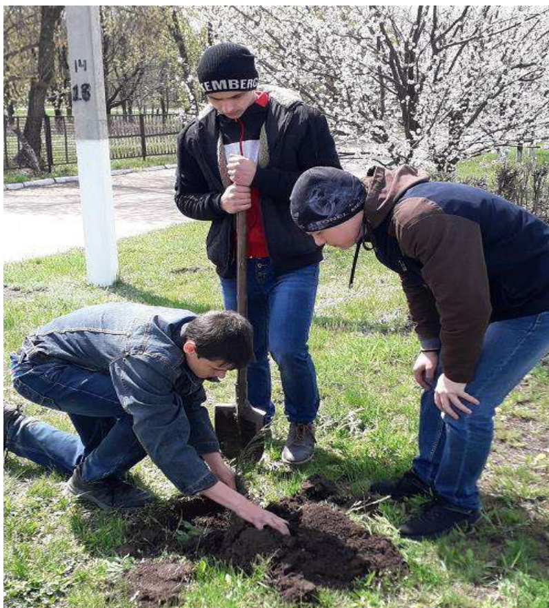
Фото 18. Акція «Благоустрій рідної школи». 02 травня 2019 року, подвір'я школи