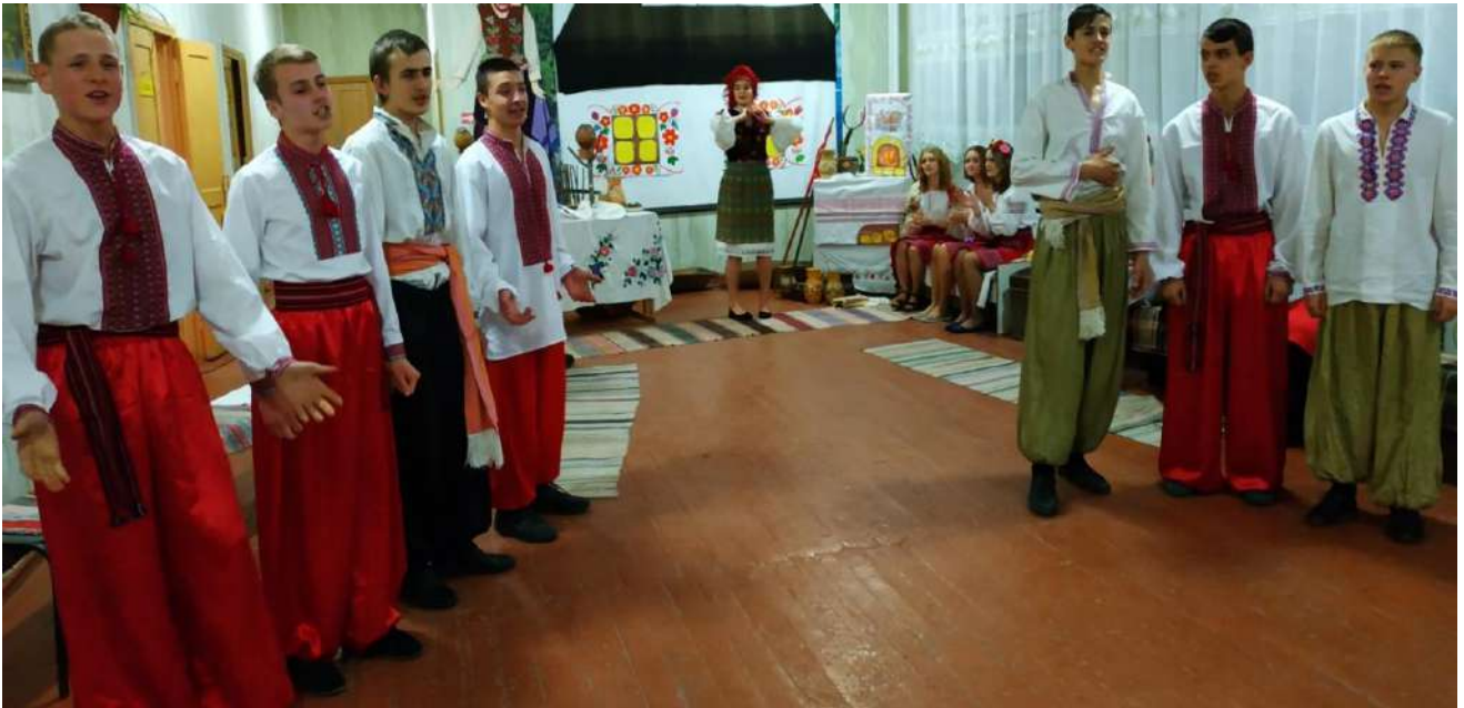
Фото 4. Козацькі розваги до дня козацтва. 12 жовтня 2019 року, вечір в школі