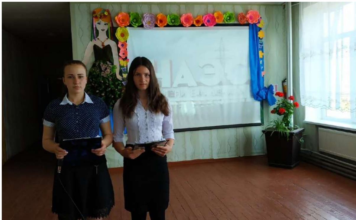
Фото 13. Перегляд фільму присвяченого аварії на Чорнобильській АЕС. 26 квітня 2019 рік, школа