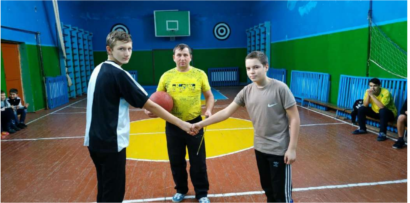
Фото 3. Спортивні змагання до Дня захисника України. 12 жовтня 2019 року Спортивний зал школи.