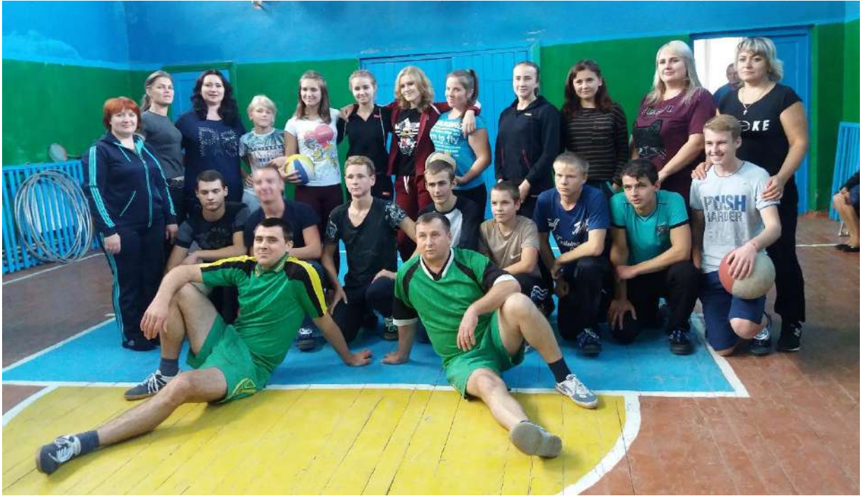
Фото 7. Змагання з волейболу між учнями та вчителями школи присвячені Дню Збройних Сил України. 6 грудня 2019 рік. Спортивний зал школи