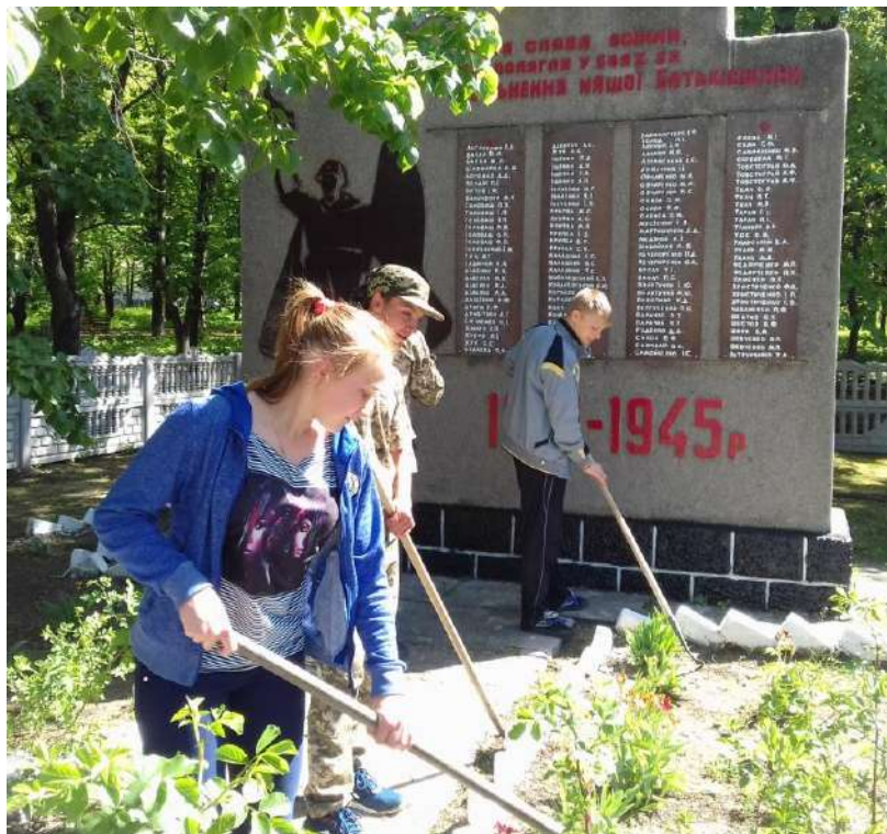
Фото 17. Упорядкування пам'ятників, братських могил, місць поховання воїнів, загиблих у Другій світовій війні. 02 травня 2019 рік