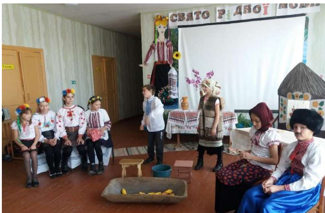
Фото 6. Свято рідної мови. 09 листопада 2019, школа