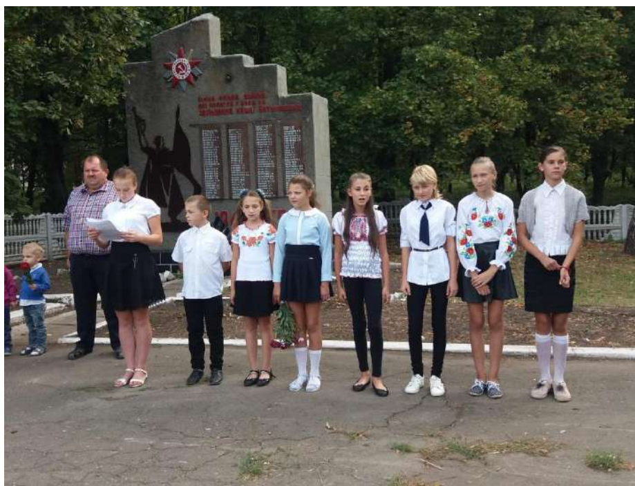
Фото 1. Учасники мітингу присвяченого Дню визволення Близнюківщини від нацистських загарбників. 16 вересня 2019 року, центральна площа села Добровілля