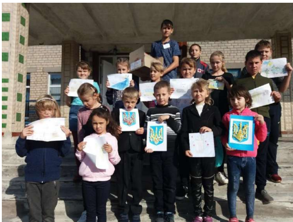
Фото 2. Участь учнів у акції «Допоможи воїну АТО». 10 жовтня 2019 рік, школа