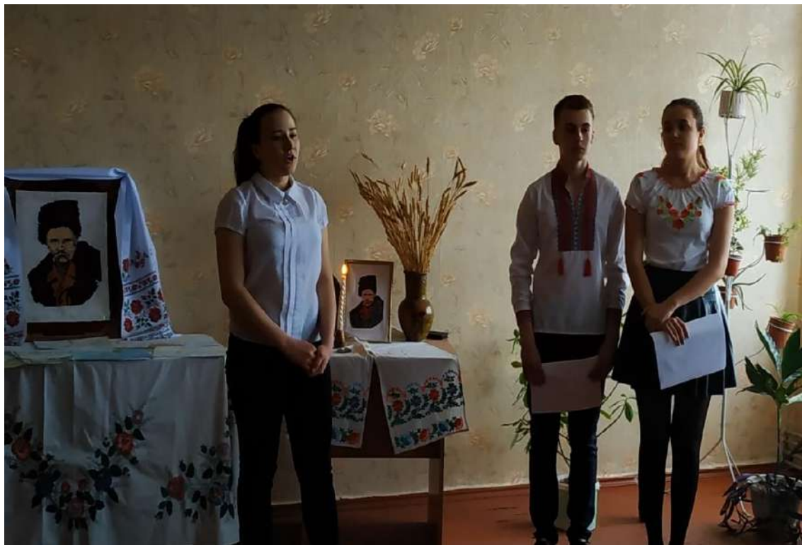
Фото 12. Заходи присвячені дню народження Т.Г. Шевченка . 09 березня 2019рік, школа