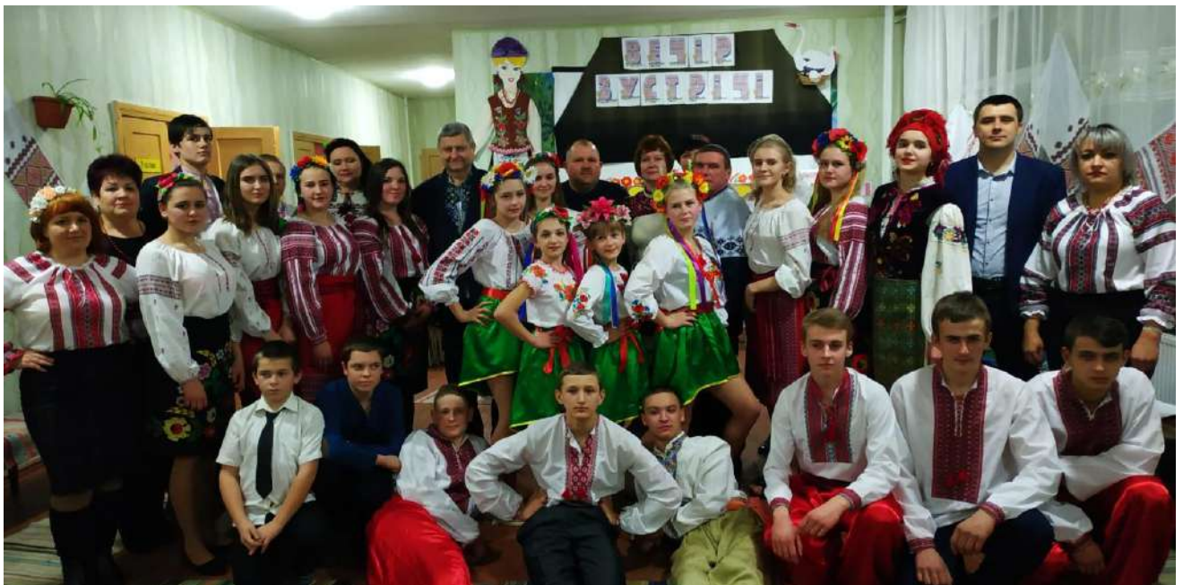
Фото10. Вечір зустрічі різних поколінь « Ми діти козацького роду». 15 лютого 2019 року, школа