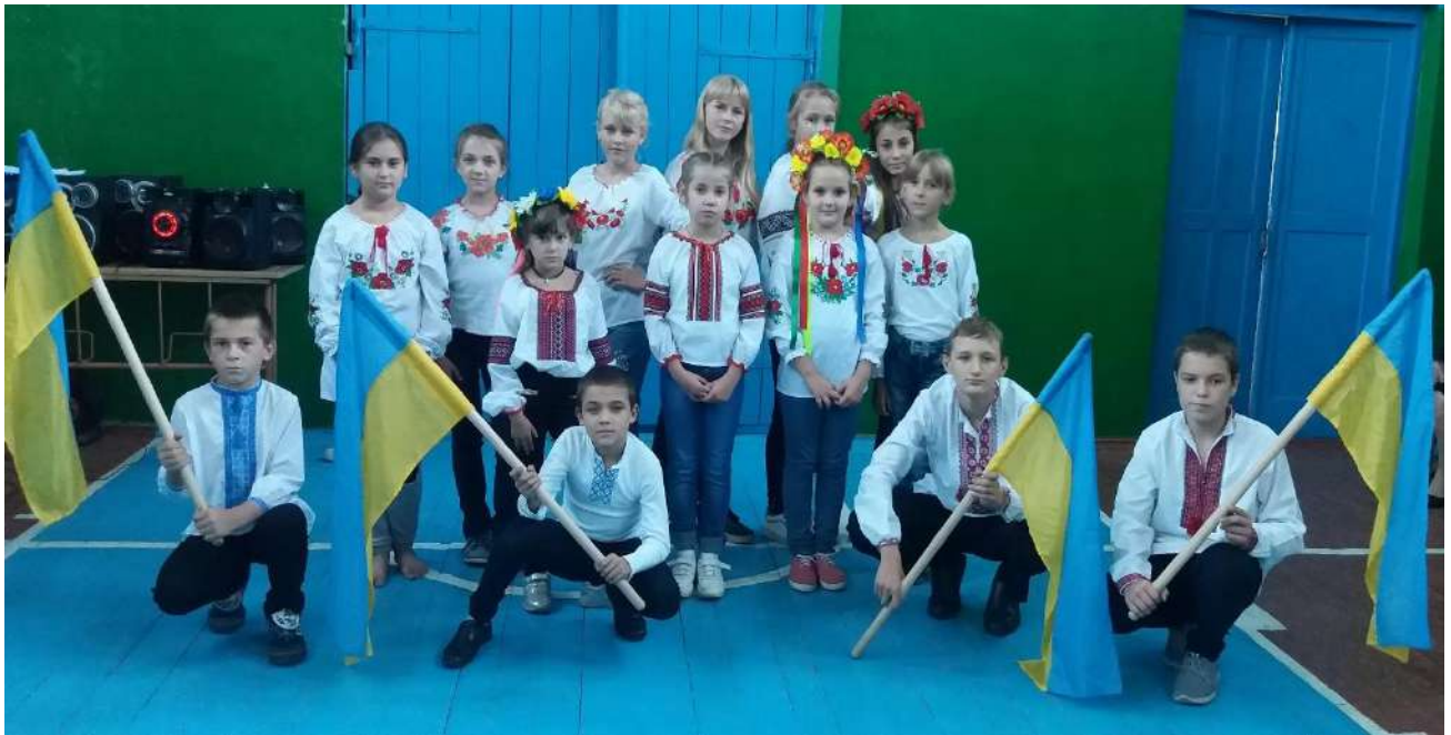
Фото 9 Свято до Дня Соборності України. 22 січня 2019 рік, спортивна зала школи