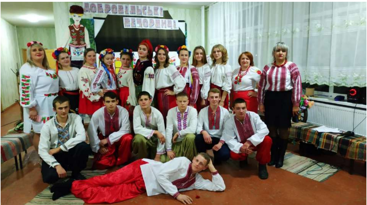
Фото 8. Добровільські вечорниці 10-11 клас. 13 грудня 2019 рік, школа